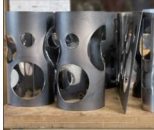
Parmi plusieurs projets, les lampes sont sorties du lot.