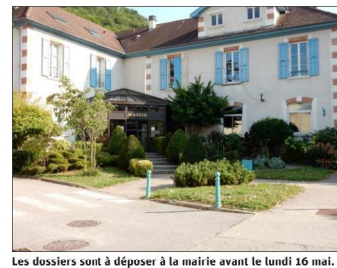
Les dossiers sont à déposer à la mairie avant le lundi 16 mai.

Pour les Giérois âgés de moins de 17 ans, les chantiers jeunes sont organisés par Gières Jeunesse.