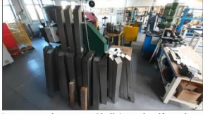
Les poteaux du parcours Biodiv' avec les décorations.