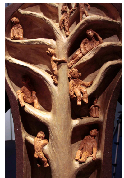
« La Vie » (détail, verso de la sculpture) Marie Mathias